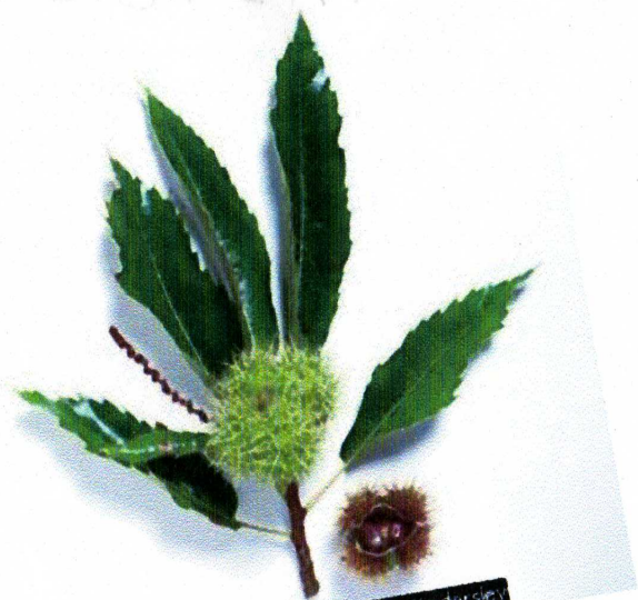
Encarta Enciclopedia, Matthew Ward/Dorling Kindersley

Extract other people's chestnuts from the fire.